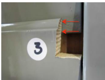
Abbildung 3: Musterstelle im Detail